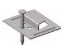
F602 / F602-3 / F602SB

acier zingué clips à clouer Utiliser avec F551 et pousse-clous M04 (à commander séparément) Pour panneaux languettes de 2,5 à 5mm