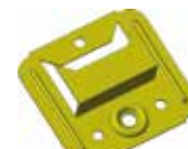
F004SKVCSB F005SKVCSB F006SKVCSB