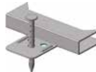
F003 / F003SB / F004